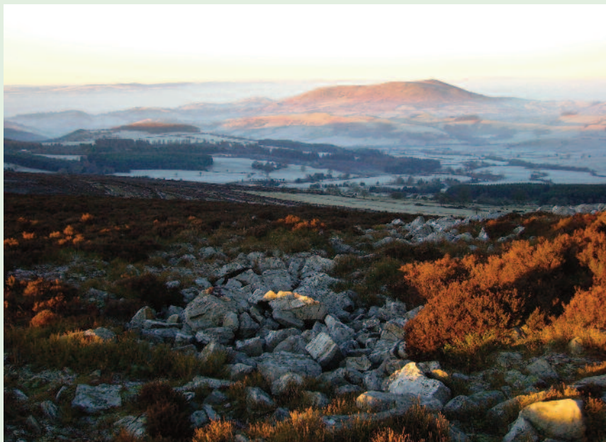
Golygfa o Corndon a Chymru, o gyfeiriad Stiperstones yn sir Awythig

Mae'r rhywogaethau prin a fyddai'n elwa o'r cynllun yn cynnwys y gylfinir, y gïach a'r